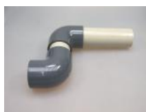
Rücklauf zum Teich